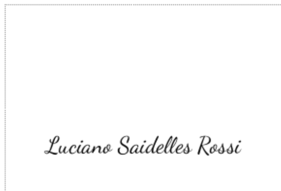
Assinatura de Luciano Saidelles Rossi

ZapSign Token: c060d470-****-****-****-71e7a8039ea9